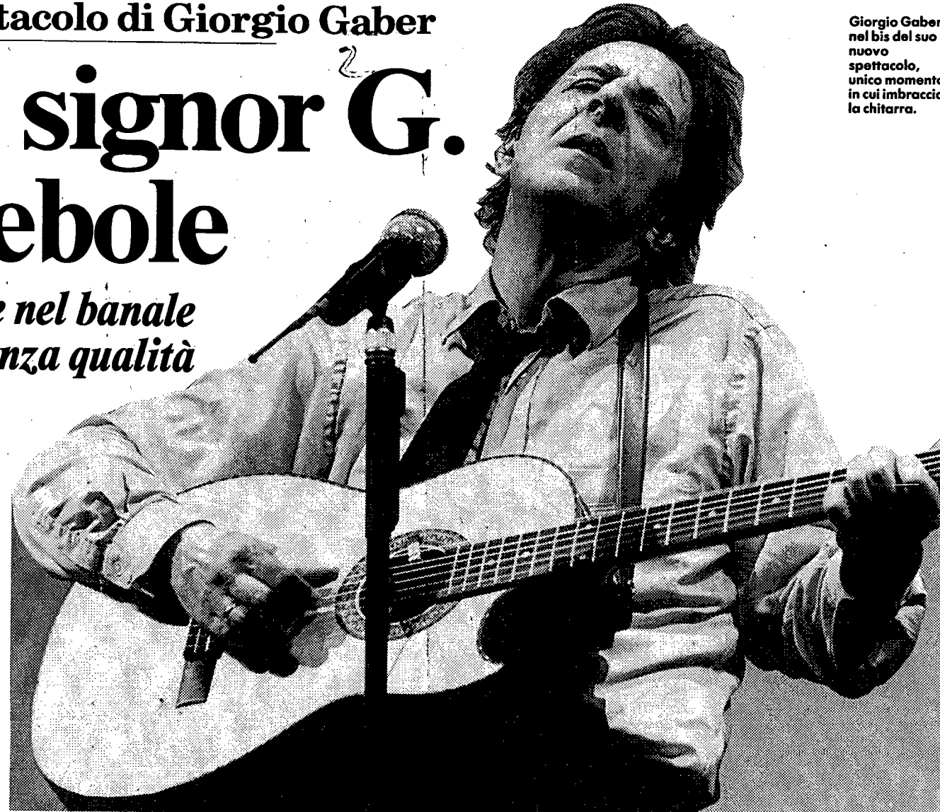
Giorgio Gaber nel bis del suo nuovo spettacolo, unico momento in cui imbraccia la chitarra.

Il messaggio è chiaro. Anche - se permettete - paurosamente banale. Il sottotitolo de «Il dio bambino» potrebbe essere anche «Disavventure di un Uomo senza Qualità salvato da una gravidanza». Resta però da dimostrare che il Peter Pan in doppiopetto grigio, che si sente male nella pelle dell'intellettuale disorganico e si rifugia nel privato come nell'utero materno, possa considerarsi salvato dall'innocente creatura messa al mondo dalla moglie, che lo strappa dal tenace egotismo d'antan, lo costringe a «sporcarsi con la vita» e lo precipita nell'ovatta di un trantran coniugale che, se non è più l'in-